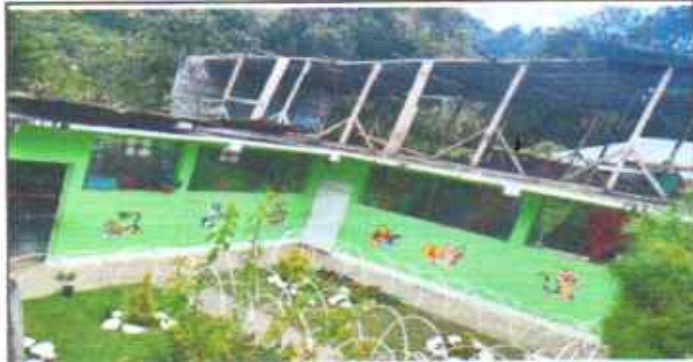
Foto 1: Mejoramiento de losa con pañuelos de tipo impermeabilizante.