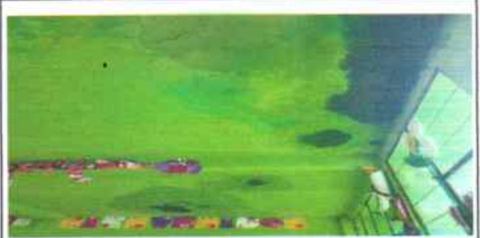
Foto 2: Mejoramiento de losa con pañuelo de tipo impermeabilizante.